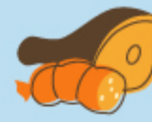
Carnes y embutidos