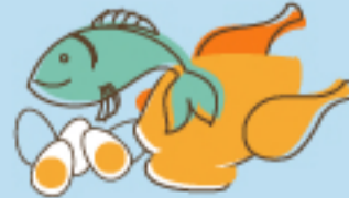
Pescado / Pollo