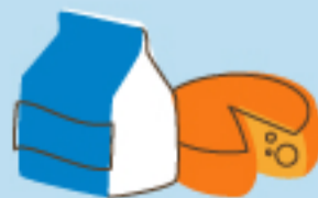
Leche y derivados