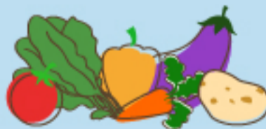
Verduras / Hortalizas